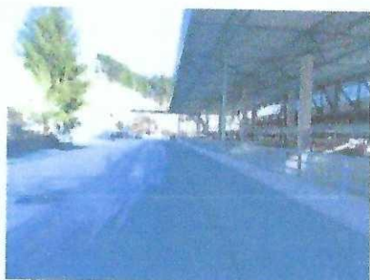
9. zgrada kogeneracije