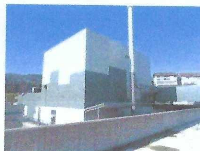
9. zgrada kogeneracije